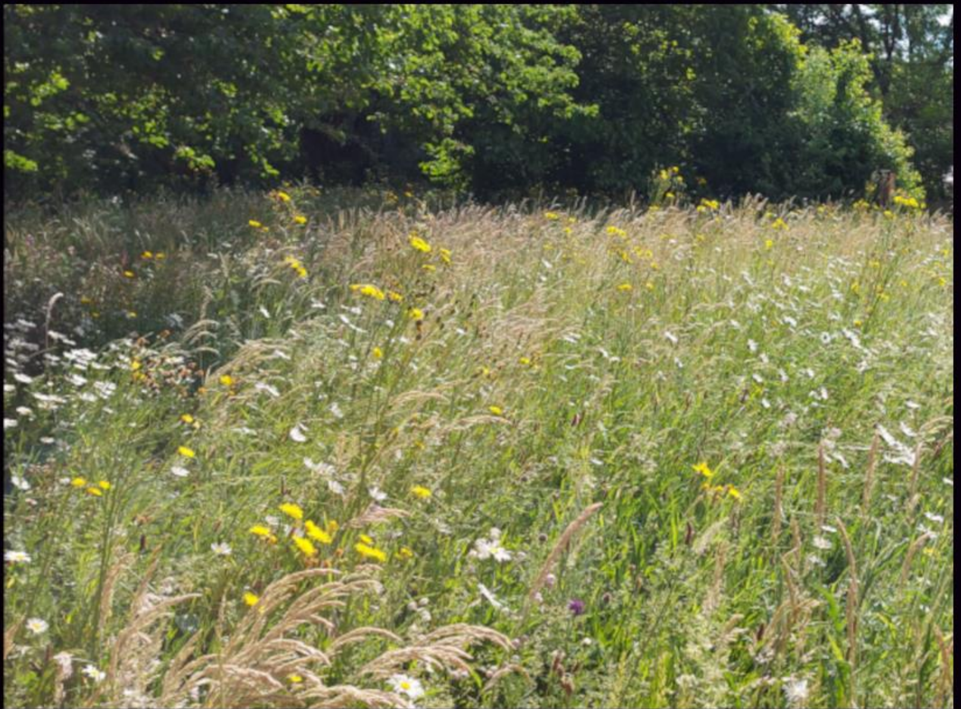
GymNO-Blumenwiese Mai 2022