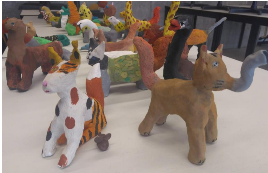
Der Zoo der fantastischen Tiere plastisches Arbeiten mit Ton Klasse 5