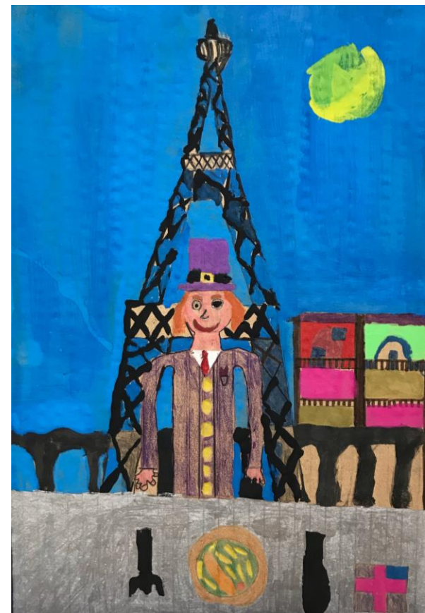
Die Tafelrunde der feinen Herren und Damen Material-Assemblage Klasse 5