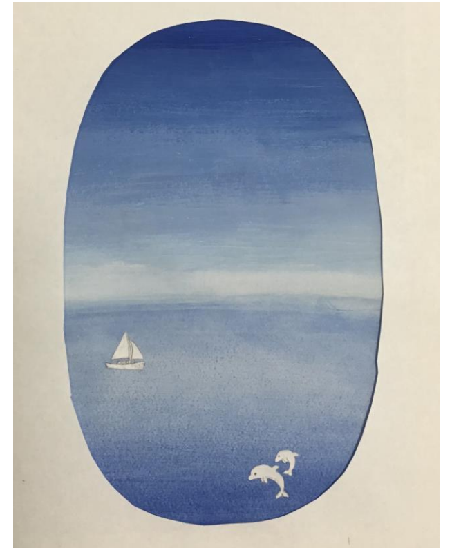
Flugzeugfenster Wasserfarben Klasse 5