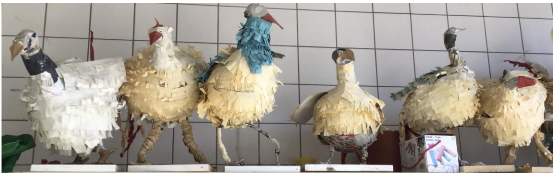
Verrückte Hühner und schräge Vögel plastisches Arbeiten mit kaschiertem Papier Klasse 6